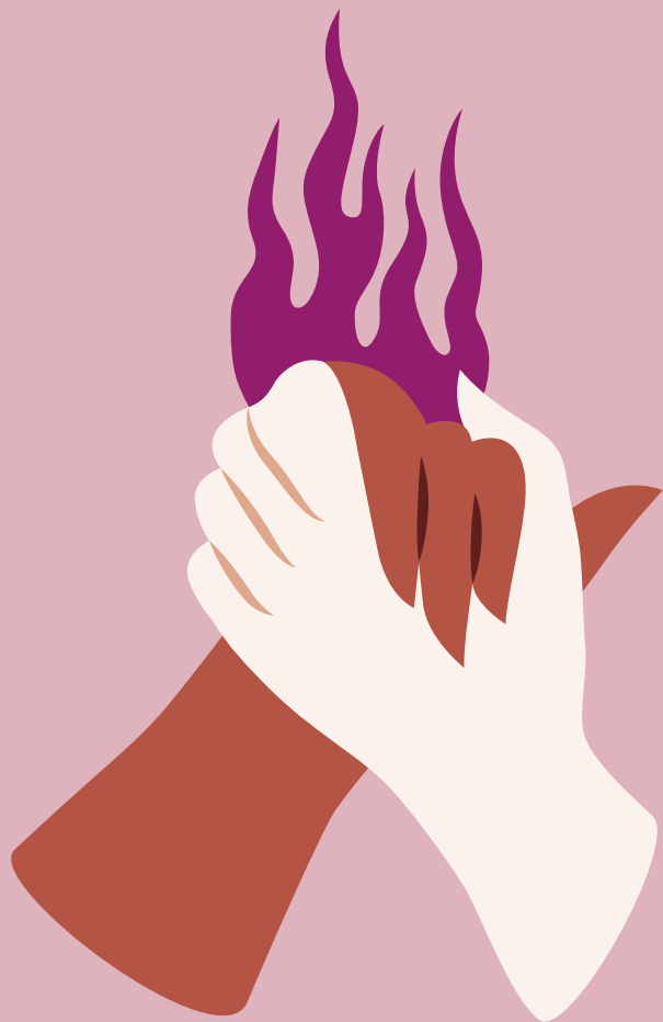
ILLUSTRATION & DESIGN ALEXANDRA DE ASSUNÇÃO

IMPRIMÉ EN 2024 L'HUILLEUR _ 123, RUE D'UCKANGE B.P. 80056 - 57192 FLORANGE CEDEX